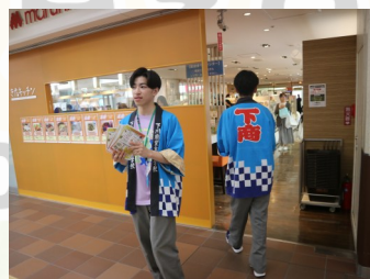
チラシ配りで集客アップ