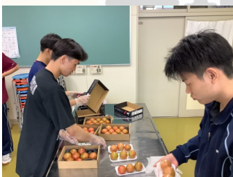
フルーツトマトのバック詰め