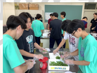
スナックエンドウのバック詰め