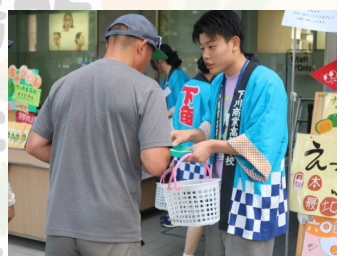
丁寧な接客を心掛けました