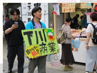
広報活動も積極的に