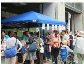
多数のご来場をいただきました